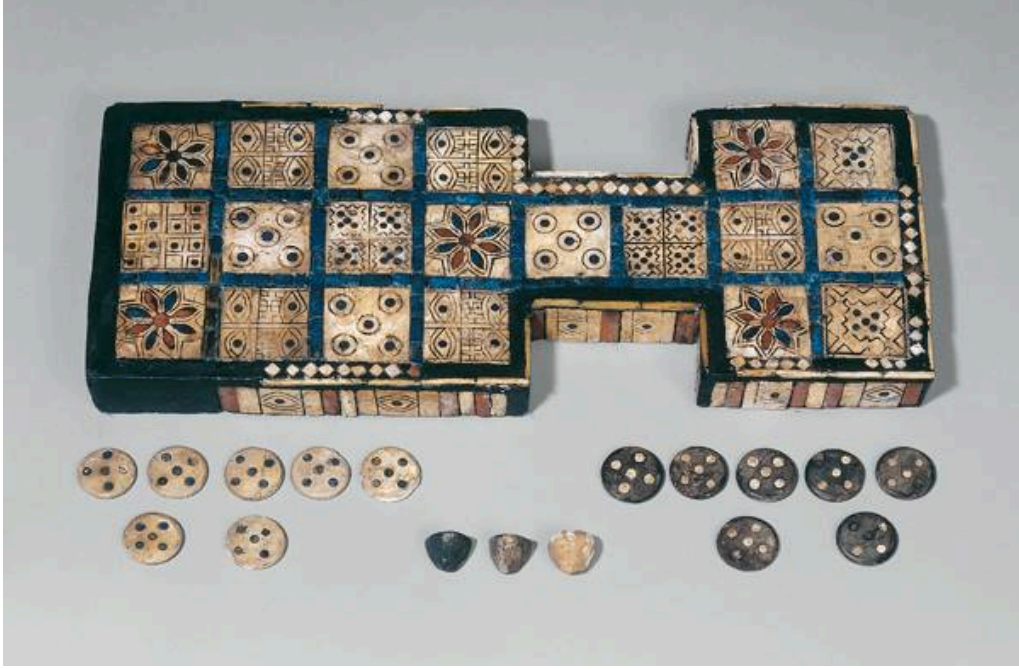
20 Kare (Ur Kraliyet Oyunu) - M.Ö. 2600

Üstelik bu gözle bakılınca Mezopotamya'da tarih boyunca oynanmış benzer oyunlar da bize göz kırpar gibi oluyor. Bakınız aşağıdaki iki örnek.