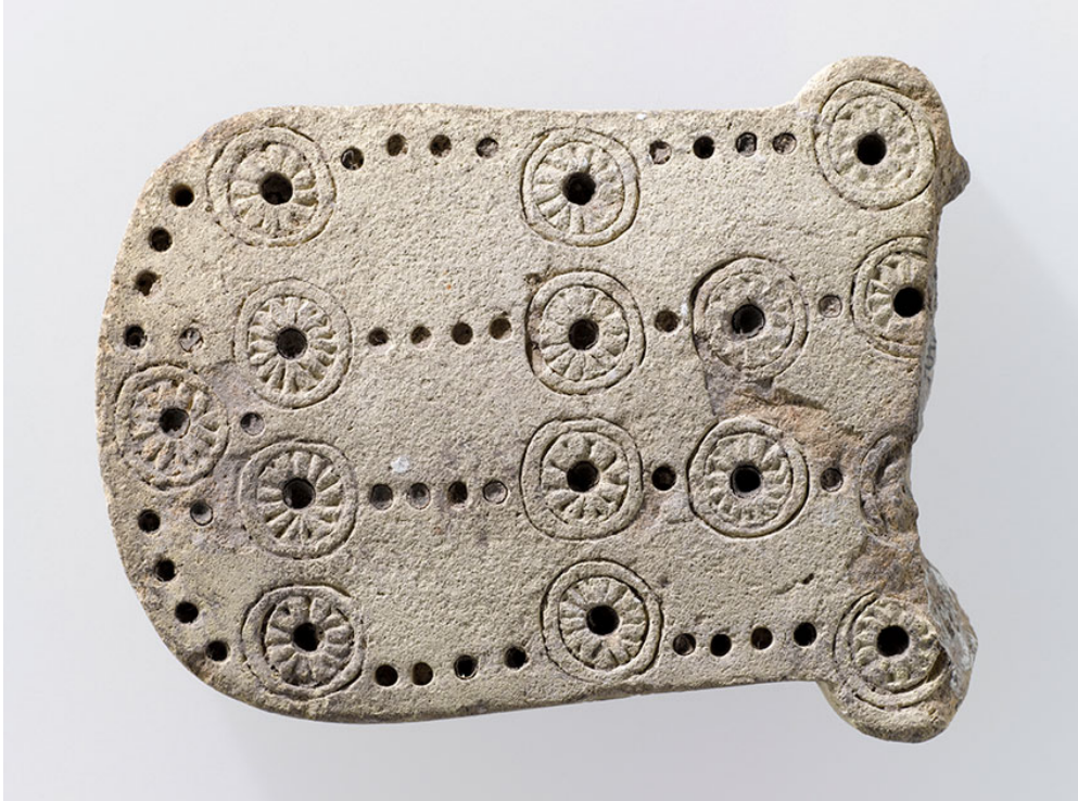
58 Delik Oyunu - M.Ö. 100-200